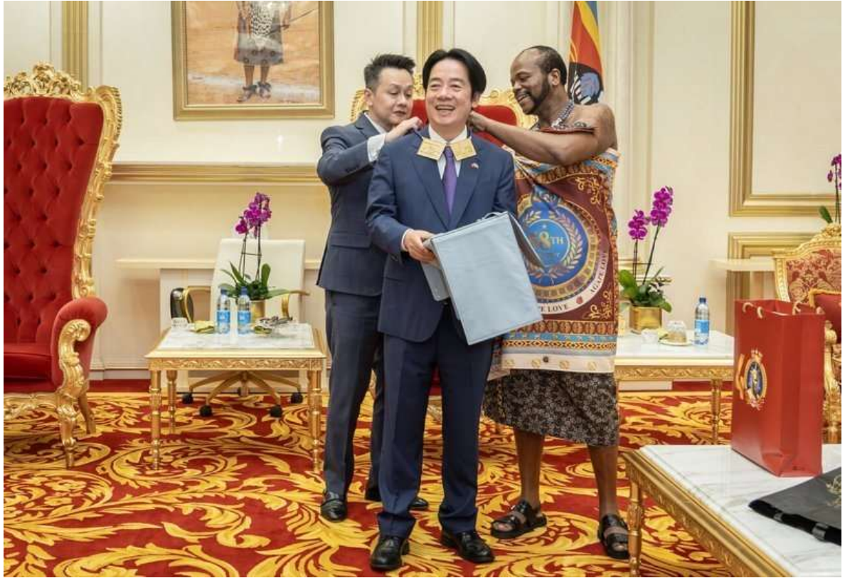
賴清德總統訪問非洲友邦史瓦帝尼，史瓦帝尼國王恩史瓦帝三世致贈賴總統一塊金牌項鍊。