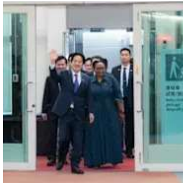
賴清德自史瓦帝尼返台 稱國力展現不在於讓人屈服